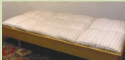
Ur-Dinkelspreu-Matratten: Liegen wie im Sand, nur weicher

Maximale Leistungsfähigkeit und Wohlbefinden setzen Gesundheit voraus, die ihrerseits gepflegt werden muss. Dazu gehört der tiefe Schlaf. Er wird gefördert durch kieselsäurehaltige Ur-Dinkelspreumatratten mit speziell gesteppten Kissen.