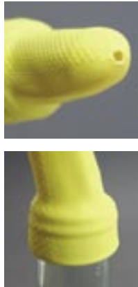
Ölfinger: Fingerspitze eines Gummihandschuhs wegschneiden und lochen. Über Flaschenhals stülpen. Öl dosieren