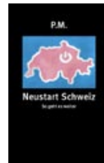
P.M.: Neustart Schweiz – so geht es weiter. Edition Zeitpunkt, 2008. 96 S. Umschlaggestaltung und «Bierdeckelillustrationen»: Kaspar Flueck. Fr. 18.70. Bestellkarte S. 50

Um die Infektion möglichst einladend zu machen, hat der Verlag aus «Neustart Schweiz» ein schön gestaltetes, in jede Rocktasche passendes Buch gemacht, das schon beim ersten Griff signalisieren soll: Das darf unter die Haut gehen. Es ist nicht als Antwort auf die Finanzkrise gedacht, aber es könnte eine sein, obwohl der fehlende Verweis auf alternative Geldmodelle eine Lücke darstellt, die bei einer nächsten Auflage geschlossen werden dürfte. Erhellender, anregender und ansteckender Lesestoff ist es allemal.